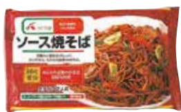
ACソース焼きそば 1箱

はがきの裏面、希望の商品に○を付けてください。 アンケート締切日 4月27日(火) 当日消印有効