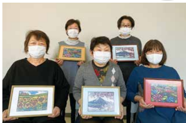
シールちぎりあーとを作成した西部支部女性部役員ら

2月22日、矢吹中央支店会議で「シールちぎりあーと」を実施し、女性部西部支部役員5人が参加しました。