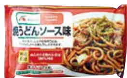
AC焼うどんソース 1箱