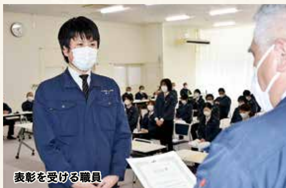
表彰を受ける職員

また「各部門報奨者」「永年勤続者」「職員資格認証試験等合格者」の優績職員の表彰も行われました。