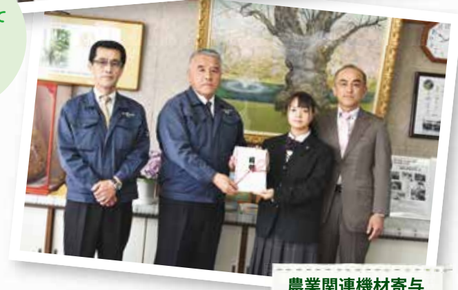
農業関連機材寄与