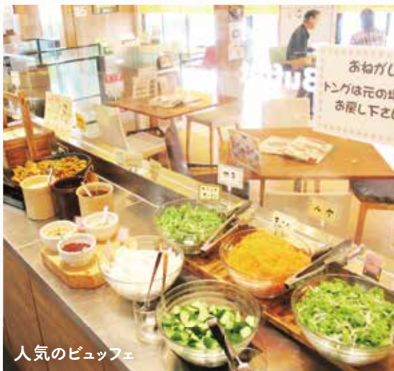
人気のビュッフェ