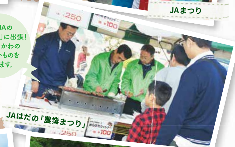
JAはだの「農業まつり」

秋の棚倉町を 10kmまたは5km 歩くイベント。 豚汁やパン、 缶バッジなどの 特典があります！