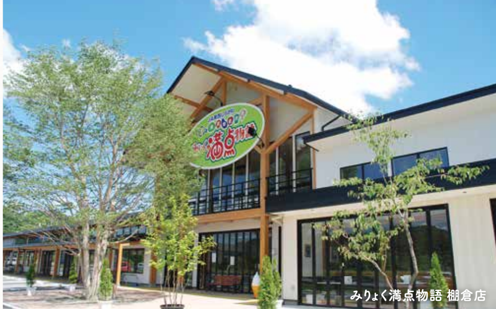
みりよく満点物語 棚倉店

平成25年3月に、棚倉町下山本地区に設立しましたファーマーズマーケット「みりよく満点物語」は施設面積延べ1,250㎡の農産物直売所です。直売所に併設して、新鮮な旬の地元食材をふんだんに使った旬彩レストラン「山ぼうし」と新鮮な牛乳を楽しむ「ミルク工房」を設置しました。また、コミュニティスペースや研修室もあり、地元の憩いの場となっております。みりよく満点物語は、棚倉店以外に矢吹店と矢祭店もありますので、お気軽にお立ち寄りください。