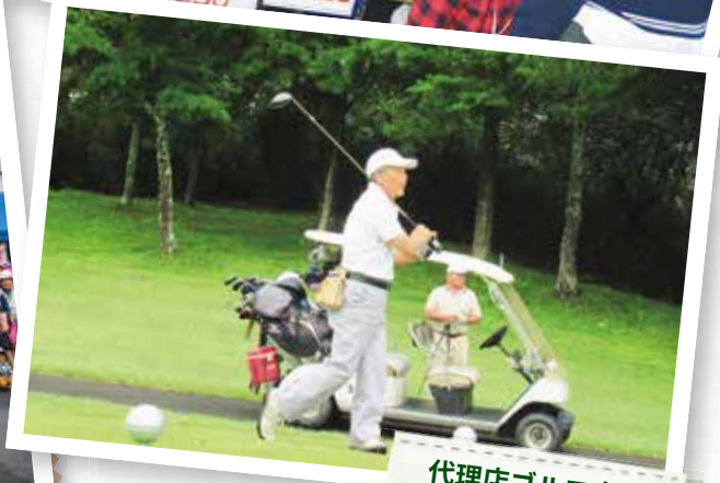
代理店ゴルフ大会