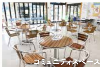
コミュニティスペース

みりよく満点物語にて、JAカードでお買い物すると、キャッシュレス決済ポイント還元制度により税込価格の 5% のポイントが付与されます！（2020年6月末まで） またJA直売所は、JAカードによる 5%割引 を展開中で、ポイントと併せて「 10%お得 」となっています！